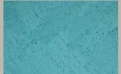
25 • 50 ml S5