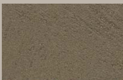
9 • 200 ml T29 + 50 ml T24