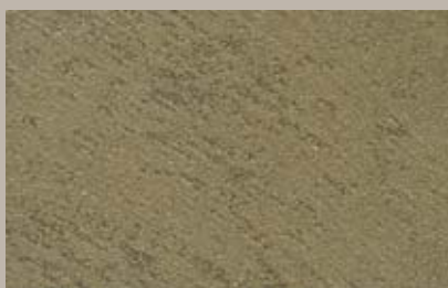
5 • 30 ml T24