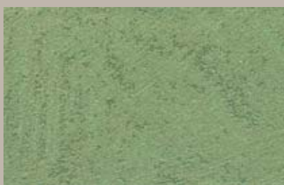
11 • 50 ml S5