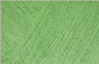
67 • 100 ml T25 + 50 ml T31