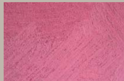
54 • 200 ml T28 + 15 ml T29