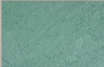
19 • 50 ml S6