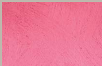
53 • 200 ml T28