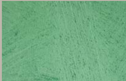
68 • 100 ml T31