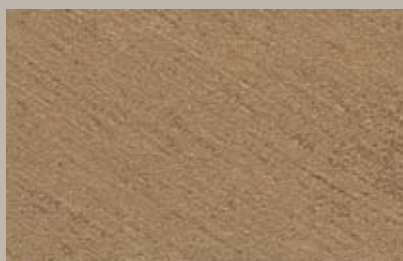
6 • 50 ml T28 + 15 ml T24