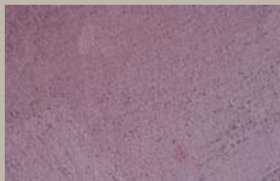
55 • 50 ml T22 + 50 ml T29