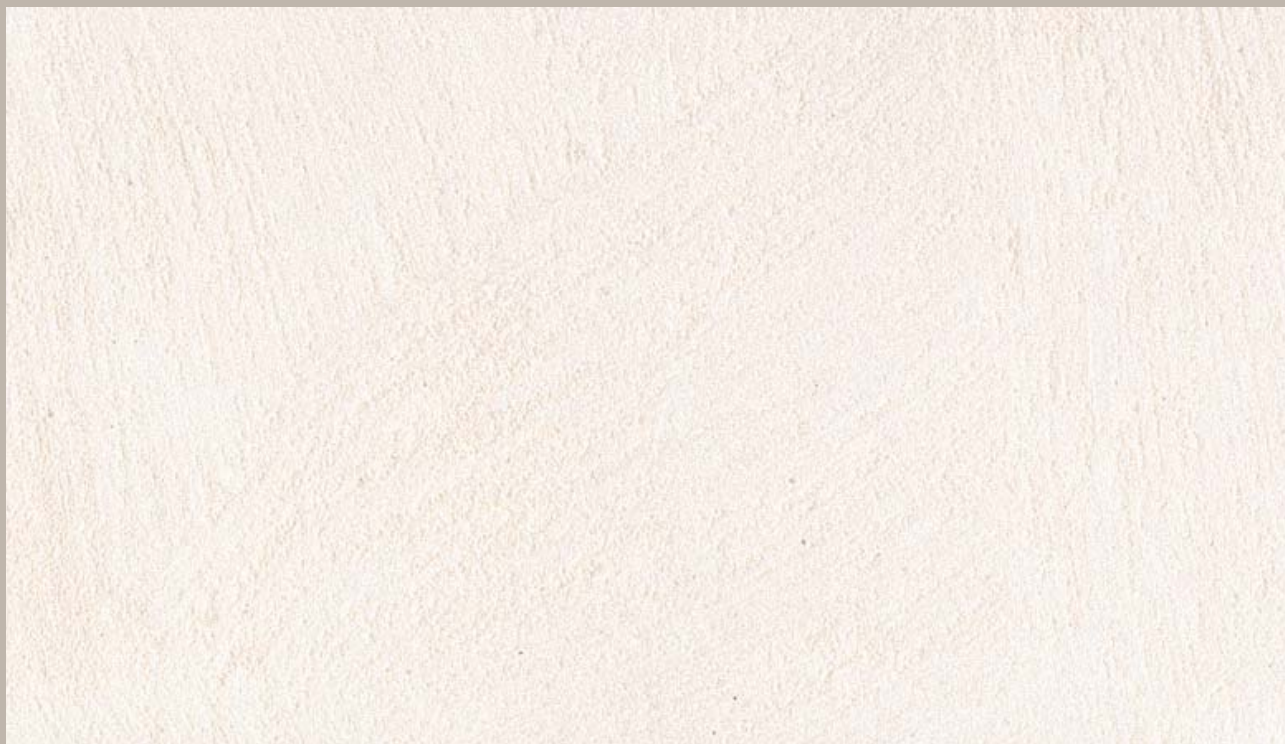
90 • Samsara Acciaio (Steel)