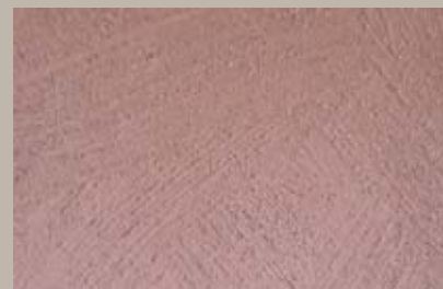
52 • 15 ml T24 + 50 ml S2