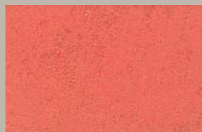
13 • 200 ml T28