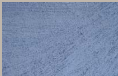
30 • 200 ml T28 + 15 ml T24 + 50 ml T30