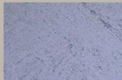
57 • 100 ml T28 + 50 ml T30