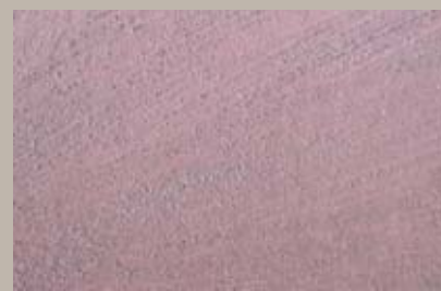
49 • 100 ml T22 + 15 ml T30 + 15 ml T28