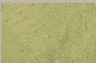
8 • 50 ml T32