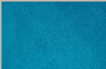
70 • 100 ml T30 + 50 ml S5