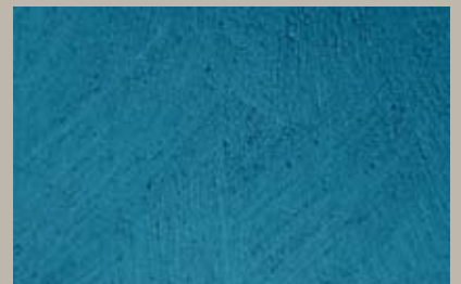
71 • 50 ml S5 + 100 ml T30 + 15 ml T24