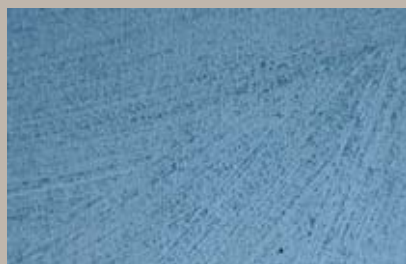
59 • 50 ml T30 + 50 ml T28