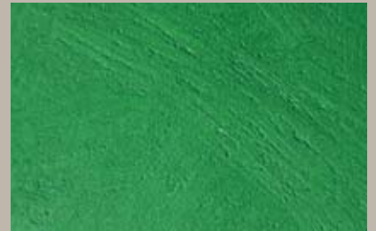
69 • 250 ml T31