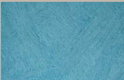
22 • 15 ml T30