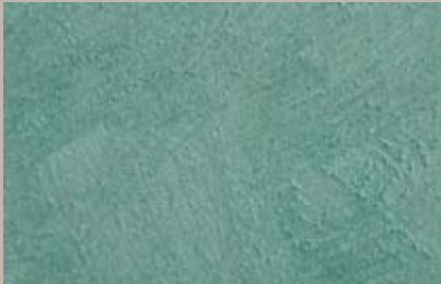
16 • 15 ml T32