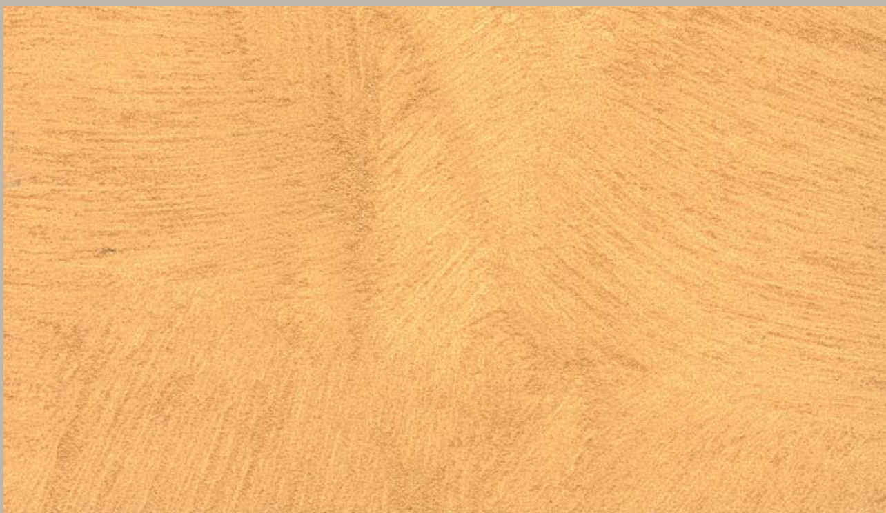
1 • Samsara Oro (Gold)