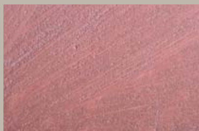
48 • 100 ml T22