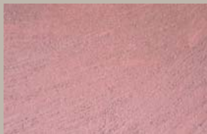
51 • 150 ml T22