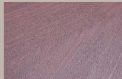
27 • 200 ml T28 + 15 ml T24